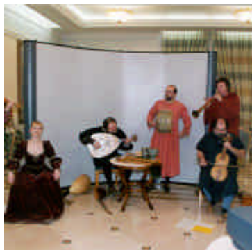
U umetničkom programu učestvovao je ansambl "Renesans"