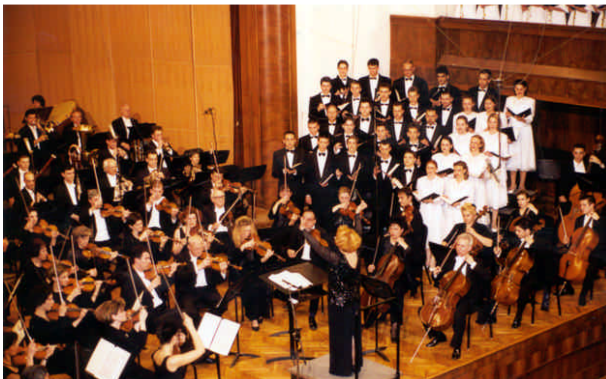
Na sceni Kolarčeve zadužbine bilo je preko 200 izvođača

U programu je premijerno izvedena: Božanstvena liturgija predeosvećenih darova , Dimitrija Golemovića i kantata Aleksandar Nevski Sergeja Prokofjeva. Sav prihod sa koncerta bio je namenjen Centru za zaštitu odojčadi, dece i omladine iz Beograda.