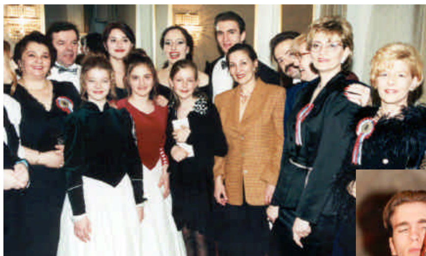
Mladi umetnik sa članovima porodice Karić (1996.god)

E-mail : karicfoundation@yahoo.com www.karicfoundation.com