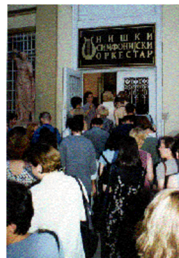
Ulaznice za koncert bile su rasprodate